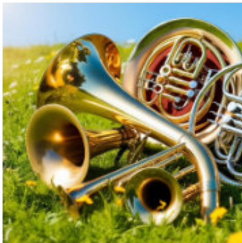
Es grüßt Ihr Posaunenchor

Wir spielen kostenlos, freuen uns aber immer über Spenden für unsere Nachwuchsarbeit.